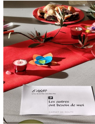
B'Abba pour les collégiens