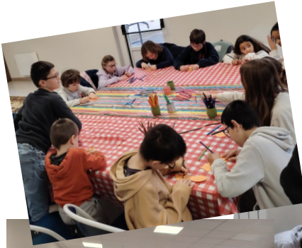
KT VACANCES Mercredi des Cendres