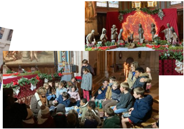
Animations pour les enfants devant la crèche à la cathédrale