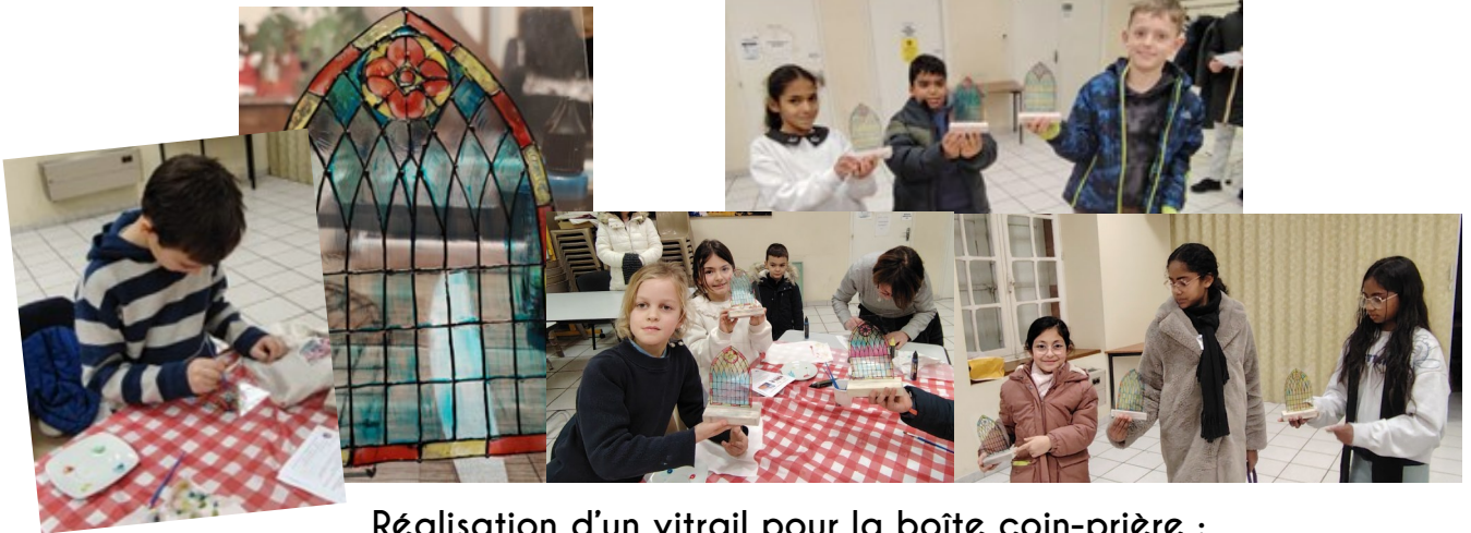
Réalisation d'un vitrail pour la boîte coin-prière : un travail minutieux couronné de succès !