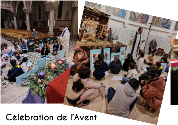
Célébration de l'Avent au Sacré-Cœur pour les enfants du caté