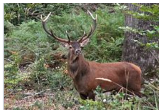
Cerf pendant la période du brame

France. Aménagée par Colbert, l'un des principaux ministres de Louis XIV, elle est connue pour abriter des chênes d'une grande qualité. Entaillée à maintes reprises, la forêt a depuis repris ses droits et arbore aujourd'hui des spécimens plusieurs fois centenaires. Depuis 2018, elle est labellisée Forêt d'exception® en raison de son patrimoine forestier remarquable et son patrimoine naturel justement mis en valeur.