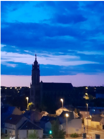
Église Saint-Barbe levé du jour